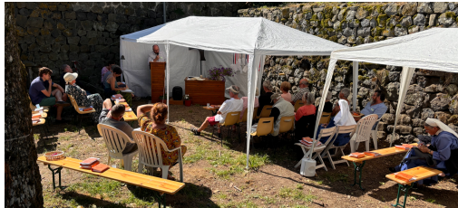
souvenir de la rencontre de 2024