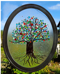
vitrail réalisé par Elisabeth Cuffel

Nous en parlons déjà dans le précédent numéro de Nouvelles : le CRAC a décidé de mettre en place un financement participatif pour financer le vitrail élaboré lors de la fête du 5 juillet. Ce vitrail sera placé dans l'espace spirituel de la maison. Une page de collecte de fonds ou « crowdfunding » est en place sur helloasso. Pour vous connecter et soutenir notre démarche il suffit de scanner le QRCode ci-contre. Merci à celles et ceux qui ont déjà pu nous aider et à celles et ceux qui pourront encore le faire :